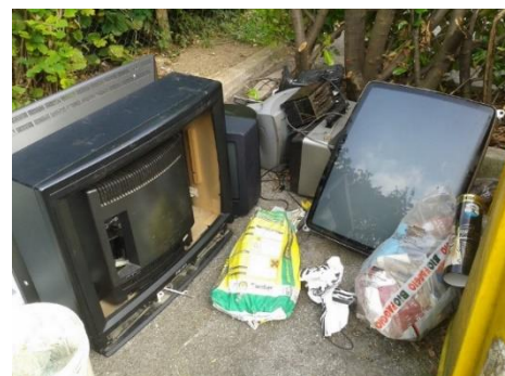
Esempio di situazione da evitare